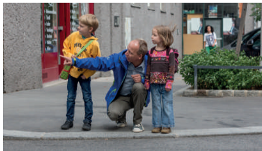
Regelmäßiges, gemeinsames Training ist wichtig!

Gehen Sie mit Ihrem Kind den Schulweg ab und erklären Sie ihm, warum es wo gefährlich ist und worauf es als Fußgängerin bzw. Fußgänger achten muss. Üben Sie problematische Stellen (siehe Schulwegplan) besonders gut! Beim nächsten Mal lassen Sie sich bereits von Ihrem Kind führen, das dabei über sein Verhalten spricht. So können Sie feststellen, ob es alles richtig verstanden hat und eventuell korrigierend eingreifen.