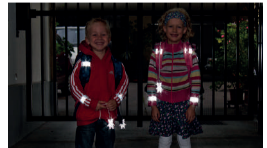
Sicherheit durch Sichtbarkeit!

Sorgen Sie dafür, dass Ihr Kind im Straßenverkehr rechtzeitig gesehen wird! Gerade im Herbst und Winter, wenn es in der Früh noch dunkel ist oder bei nebligem Wetter, ist helle Kleidung von Vorteil. Noch besser wirken Reflektoren an Kleidung und Schultaschen – mit diesen können Kinder von Fahrzeuglenkerinnen und Fahrzeuglenkern schon aus einer Entfernung von 130 Metern wahrgenommen werden.