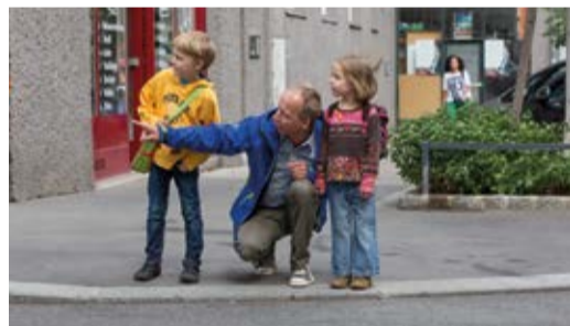
Regelmäßiges, gemeinsames Training ist wichtig!

Gehen Sie mit Ihrem Kind den Schulweg ab und erklären Sie ihm, warum es wo gefährlich ist und worauf es als Fußgängerin bzw. Fußgänger achten muss. Üben Sie problematische Stellen (siehe Schulwegplan) besonders gut! Beim nächsten Mal lassen Sie sich bereits von Ihrem Kind führen, das dabei über sein Verhalten spricht. So können Sie feststellen, ob es alles richtig verstanden hat und eventuell korrigierend eingreifen.