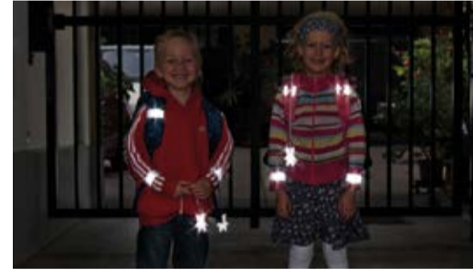
Sicherheit durch Sichtbarkeit!

Sorgen Sie dafür, dass Ihr Kind im Straßenverkehr rechtzeitig gesehen wird! Gerade im Herbst und Winter, wenn es in der Früh noch dunkel ist oder bei nebligem Wetter, ist helle Kleidung von Vorteil. Noch besser wirken Reflektoren an Kleidung und Schultaschen – mit diesen können Kinder von Fahrzeuglenkerinnen und Fahrzeuglenkern schon aus einer Entfernung von 130 Metern wahrgenommen werden.