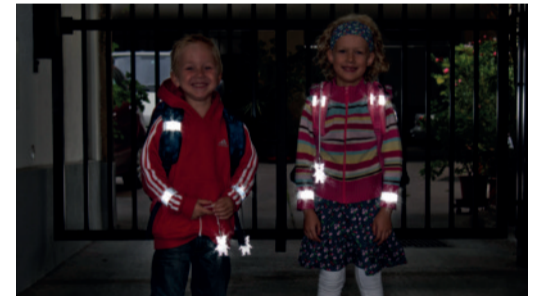
Sicherheit durch Sichtbarkeit!

Sorgen Sie dafür, dass Ihr Kind im Straßenverkehr rechtzeitig gesehen wird! Gerade im Herbst und Winter, wenn es in der Früh noch dunkel ist oder bei nebligem Wetter ist helle Kleidung von Vorteil. Noch besser wirken Reflektoren an Kleidung und Schultaschen – mit diesen können Kinder von Fahrzeuglenkerinnen und Fahrzeuglenkern schon aus einer Entfernung von 130 Metern wahrgenommen werden.