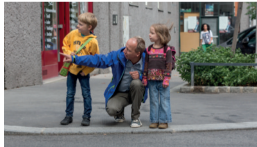
Regelmäßiges, gemeinsames Training ist wichtig!

Gehen Sie mit Ihrem Kind den Schulweg ab und erklären Sie ihm, warum es wo gefährlich ist und worauf es als Fußgängerin bzw. Fußgänger achten muss. Üben Sie problematische Stellen (siehe Schulwegplan) besonders gut! Beim nächsten Mal lassen Sie sich bereits von Ihrem Kind führen, das dabei über sein Verhalten spricht. So können Sie feststellen, ob es alles richtig verstanden hat und eventuell korrigierend eingreifen.