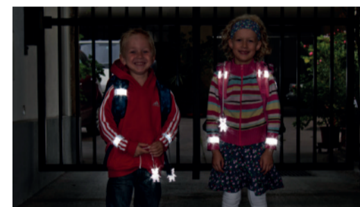
Sicherheit durch Sichtbarkeit!

Sorgen Sie dafür, dass Ihr Kind im Straßenverkehr rechtzeitig gesehen wird! Gerade im Herbst und Winter, wenn es in der Früh noch dunkel ist oder bei nebligem Wetter, ist helle Kleidung von Vorteil. Noch besser wirken Reflektoren an Kleidung und Schultaschen – mit diesen können Kinder von Fahrzeuglenkerinnen und Fahrzeuglenkern schon aus einer Entfernung von 130 Metern wahrgenommen werden.