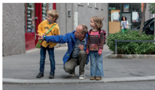
Regelmäßiges, gemeinsames Training ist wichtig!

Gehen Sie mit Ihrem Kind den Schulweg ab und erklären Sie ihm, warum es wo gefährlich ist und worauf es als Fußgängerin bzw. Fußgänger achten muss. Üben Sie problematische Stellen (siehe Schulwegplan) besonders gut! Beim nächsten Mal lassen Sie sich bereits von Ihrem Kind führen, das dabei über sein Verhalten spricht. So können Sie feststellen, ob es alles richtig verstanden hat und eventuell korrigierend eingreifen.