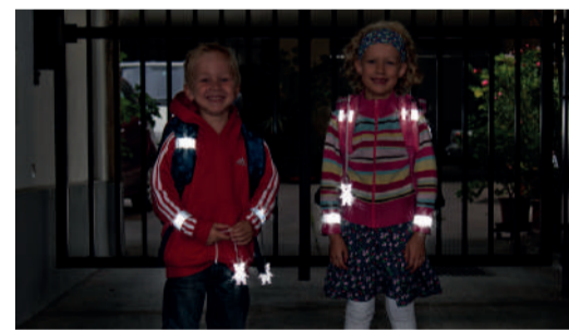
Sicherheit durch Sichtbarkeit!

Sorgen Sie dafür, dass Ihr Kind im Straßenverkehr rechtzeitig gesehen wird! Gerade im Herbst und Winter, wenn es in der Früh noch dunkel ist oder bei nebligem Wetter ist helle Kleidung von Vorteil. Noch besser wirken Reflektoren an Kleidung und Schultaschen – mit diesen können Kinder von Fahrzeuglenkerinnen und Fahrzeuglenkern schon aus einer Entfernung von 130 Metern wahrgenommen werden.