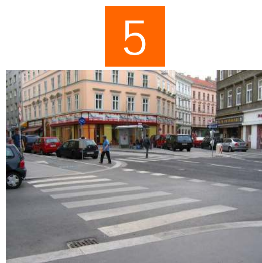
An der Kreuzung Margaretenstrasse - Preßgasse - Waaggasse - Heumühlgasse unbedingt die Zebrastreifen benutzen. Vor dem Überqueren der Radwege muss man in beide Richtungen genau schauen.