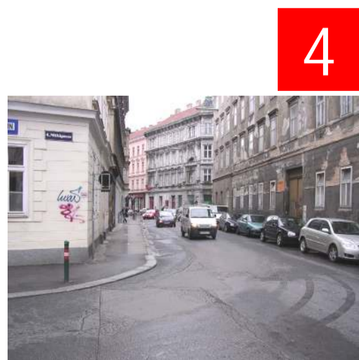
Von der Schönbrunner Straße biegen die Autofahrer oft sehr schnell in die Heumühlgasse ab. Das Überqueren der Fahrbahn an dieser Stelle ist daher gefährlich. Besser ist es, schon bei der Mühlgasse die Heumühlgasse zu überqueren.