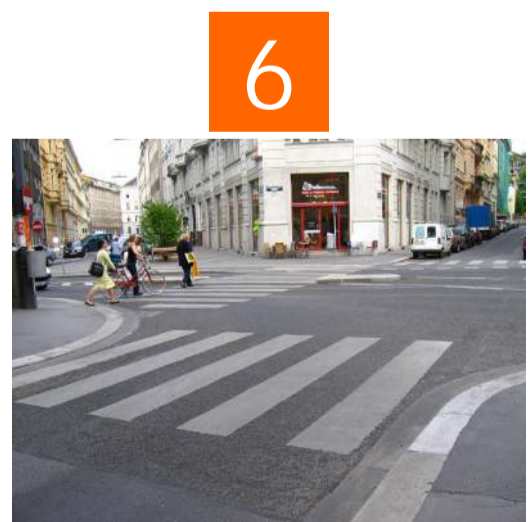
Vor dem Überqueren jedes Zebrastreifens den Autofahrern in die Augen schauen. Erst los gehen, wenn das Fahrzeug angehalten hat. Beim Überqueren der Margaretenstrasse bis zur Mittelinsel gehen, vergewissern, dass der Autofahrer anhält, erst dann weiter gehen.