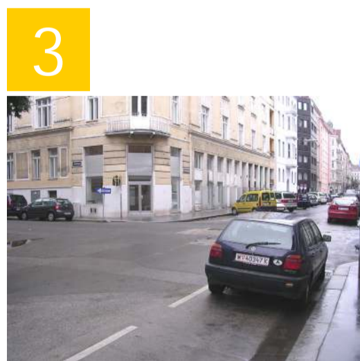
In der Großen Neugasse sind die Kreuzungen leider oft durch Autos verstellt. Das Überqueren der Straße ist aber sicher, wenn man sich gut sichtbar vor die parkenden Autos stellt.