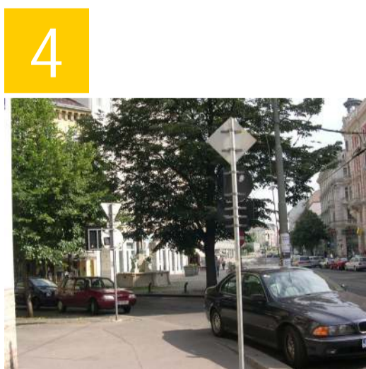
Die Stelle am Rilkeplatz ist unübersichtlich, da Autofahrer aus der Margaretenstraße kommend um die Kurve fahren. Weiters können parkende Autos die Sicht verstellen. Vergewissere dich vor dem Queren der Straße, ob sich nicht ein Autofahrer nähert.