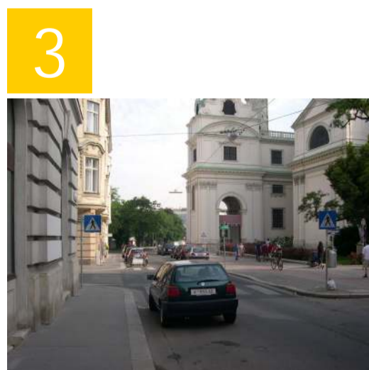
Die Kreuzung Paniglgasse / Argentinierstraße ist gut beschildert und mit einem Zebrastreifen versehen. Achte jedoch trotzdem auf Radfahrer und abbiegende Autofahrer, bevor du die Kreuzung passierst.