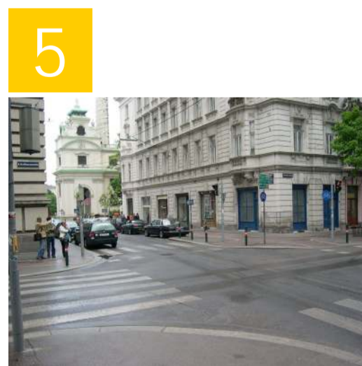
Die Kreuzung Gußhausstraße / Argentinierstraße ist gut beschildert und mit einem Zebrastreifen versehen. Achte jedoch trotzdem auf Radfahrer und abbiegende Autofahrer, bevor du über die Kreuzung gehst.