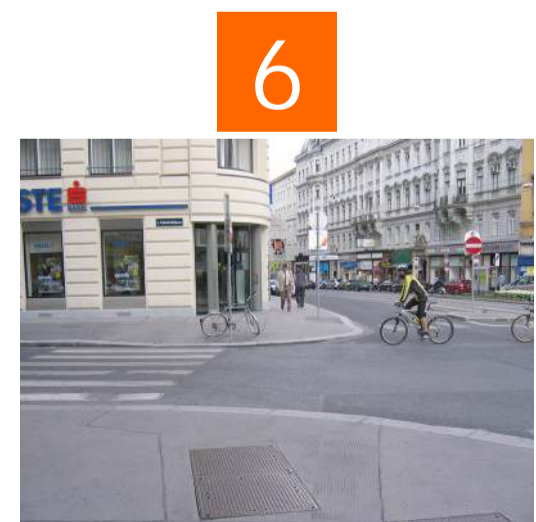
Die Kreuzung Schleifmühlgasse / Wiedner Hauptstraße ist stark befahren. Überquere hier nicht die Wiedner Hauptstraße. Schnell fahrende Radfahrer passieren den Kreuzungsbereich auch außerhalb der Radwege.