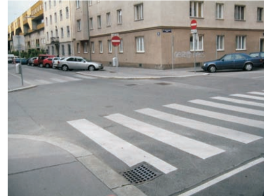
Anschützgasse / Siebeneichengasse: Nur am Zebrastreifen queren! Vor dem Queren: dem Autolenker in die Augen schauen. Anhalten des Autos abwarten, dann losgehen.