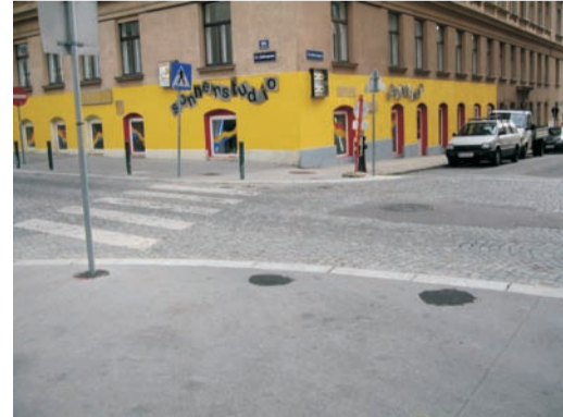
Hollergasse / Oelweingasse: Die Hollergasse bei der Oelweingasse nur beim Zebrastreifen queren.