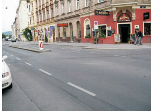
Sechshäuser Straße / Reichsapfelgasse: Hier auf keinen Fall die Sechshäuser Straße überqueren. Folge dem eingezeichneten Weg.