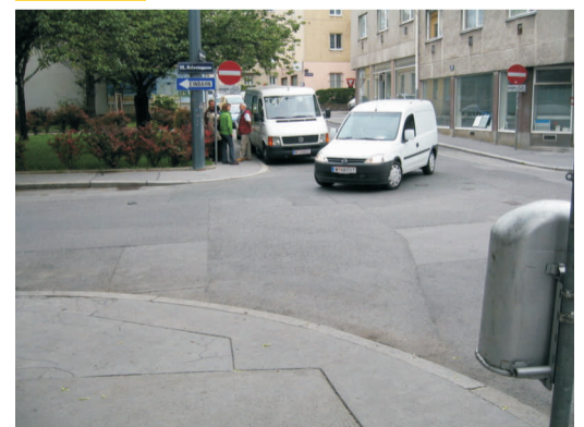
Ölweingasse / Grimmigasse: Beim Überqueren der Grimmigasse auf abbiegende Fahrzeuge achten.