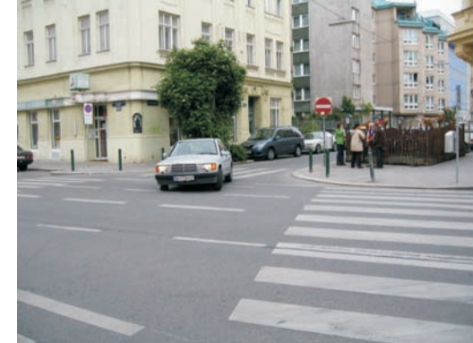
Hollergasse / Sechshäuser Straße: Die Sechshäuser Straße am Zebrastreifen in 2 Etappen queren: zuerst auf Autos von links achten. Nach deren Anhalten bis zur Mittelinsel gehen. Dort stehen bleiben und auf Autos von rechts achten. Nach deren Anhalten weitergehen.