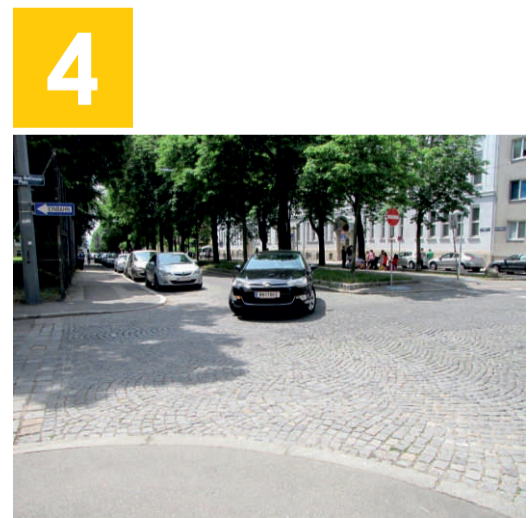
4 Johann-Hoffmann-Platz: Achte auf Fahrzeuge, die in den Johann-Hoffmann-Platz einbiegen. Bleib am Gehsteigrand stehen, warte bis kein Fahrzeug abbiegt und gehe erst dann los.