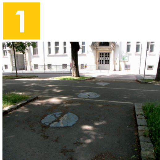
1 Radweg vor der Schule: Vergewissere dich, dass weder von links noch von rechts ein Radfahrer kommt, bevor du den Radweg querst.