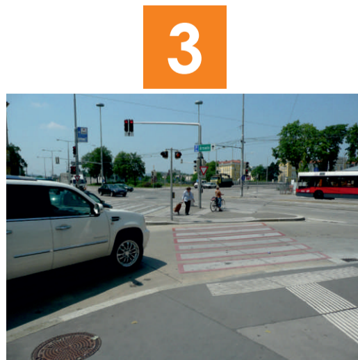
3 Wienerbergstraße / Breitenfurter Straße: Auch wenn du am Zebrastreifen eine Straße überquerst, musst du dich vorher immer vergewissern, ob das auch möglich ist. Achte hier besonders auf abbiegende Fahrzeuge. Gehe erst, wenn die Fahrer dir die Querung ermöglichen.