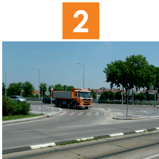
2 Wienerbergbrücke: Hier musst du auf die abbiegenden Fahrzeuge achten. Warte, bis sich kein Auto nähert oder bis die Autofahrer angehalten haben. Gehe zügig über die Straße.