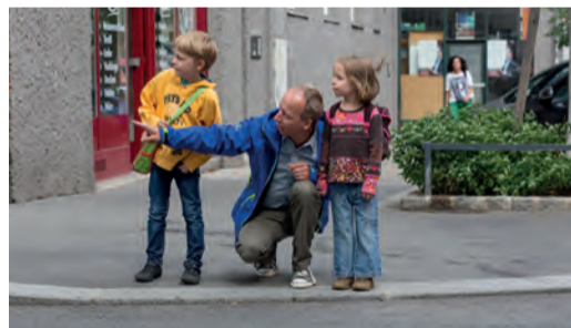
Regelmäßiges, gemeinsames Training ist wichtig!

Gehen Sie mit Ihrem Kind den Schulweg ab und erklären Sie ihm, warum es wo gefährlich ist und worauf es als Fußgängerin bzw. Fußgänger achten muss. Üben Sie problematische Stellen (siehe Schulwegplan) besonders gut. Beim nächsten Mal lassen Sie sich bereits von Ihrem Kind führen, das dabei über sein Verhalten spricht. So können Sie feststellen, ob es alles richtig verstanden hat und eventuell korrigierend eingreifen.