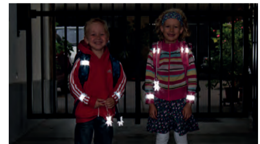
Sicherheit durch Sichtbarkeit!

Sorgen Sie dafür, dass Ihr Kind im Straßenverkehr rechtzeitig gesehen wird. Gerade im Herbst und Winter, wenn es in der Früh noch dunkel ist oder bei nebligem Wetter ist helle Kleidung von Vorteil. Noch besser wirken Reflektoren an Kleidung und Schultaschen – mit diesen können Kinder von Autofahrerinnen und -fahrern schon aus einer Entfernung von 130 Metern wahrgenommen werden.