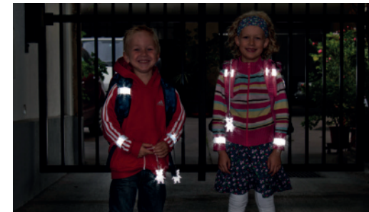
Sicherheit durch Sichtbarkeit!

Sorgen Sie dafür, dass Ihr Kind im Straßenverkehr rechtzeitig gesehen wird. Gerade im Herbst und Winter, wenn es in der Früh noch dunkel ist oder bei nebligem Wetter ist helle Kleidung von Vorteil. Noch besser wirken Reflektoren an Kleidung und Schultaschen – mit diesen können Kinder von Autofahrerinnen und -fahrern schon aus einer Entfernung von 130 Metern wahrgenommen werden.