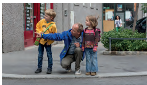
Regelmäßiges, gemeinsames Training ist wichtig!

Gehen Sie mit Ihrem Kind den Schulweg ab und erklären Sie ihm, warum es wo gefährlich ist und worauf es als Fußgängerin bzw. Fußgänger achten muss. Üben Sie problematische Stellen (siehe Schulwegplan) besonders gut. Beim nächsten Mal lassen Sie sich bereits von Ihrem Kind führen, das dabei über sein Verhalten spricht. So können Sie feststellen, ob es alles richtig verstanden hat und eventuell korrigierend eingreifen.