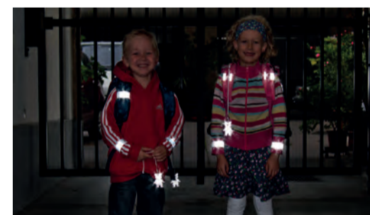
Sicherheit durch Sichtbarkeit!

Sorgen Sie dafür, dass Ihr Kind im Straßenverkehr rechtzeitig gesehen wird. Gerade im Herbst und Winter, wenn es in der Früh noch dunkel ist oder bei nebligem Wetter ist helle Kleidung von Vorteil. Noch besser wirken Reflektoren an Kleidung und Schultaschen – mit diesen können Kinder von Autofahrerinnen und -fahrern schon aus einer Entfernung von 130 Metern wahrgenommen werden.