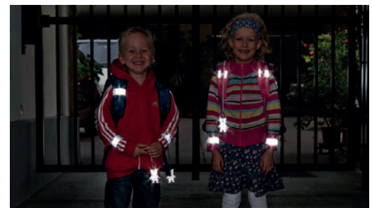
Sicherheit durch Sichtbarkeit!

Gerade im Herbst und Winter, wenn es in der Früh noch dunkel ist oder bei nebligem Wetter, ist helle Kleidung von Vorteil. Noch besser wirken Reflektoren an Kleidung und Schultaschen – mit diesen können Kinder schon aus einer Entfernung von 130 Metern wahrgenommen werden.