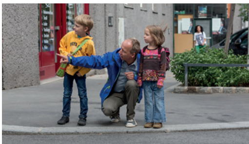
Regelmäßiges, gemeinsames Training ist wichtig!

Gehen Sie mit Ihrem Kind den Schulweg ab und erklären Sie ihm, warum es wo gefährlich ist und worauf es als Fußgänger:in achten muss. Üben Sie problematische Stellen (siehe Schulwegplan) besonders gut! Beim nächsten Mal lassen Sie sich bereits von Ihrem Kind führen, das dabei über sein Verhalten spricht. So können Sie feststellen, ob es alles richtig verstanden hat und eventuell korrigierend eingreifen.