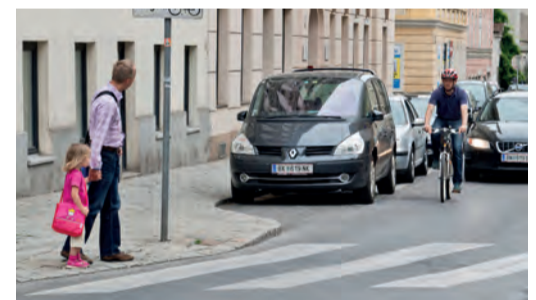
Immer Halt vor dem Zebrastreifen!

Sorgen Sie dafür, dass Ihr Kind im Straßenverkehr rechtzeitig gesehen wird. Gerade im Herbst und Winter, wenn es in der Früh noch dunkel ist oder bei nebligem Wetter ist helle Kleidung von Vorteil. Noch besser wirken Reflektoren an Kleidung und Schultaschen – mit diesen können Kinder von Autofahrerinnen und -fahrern schon aus einer Entfernung von 130 Metern wahrgenommen werden.