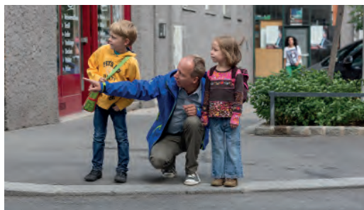
Regelmäßiges, gemeinsames Training ist wichtig!

Gehen Sie mit Ihrem Kind den Schulweg ab und erklären Sie ihm, warum es wo gefährlich ist und worauf es als Fußgängerin bzw. Fußgänger achten muss. Üben Sie problematische Stellen (siehe Schulwegplan) besonders gut. Beim nächsten Mal lassen Sie sich bereits von Ihrem Kind führen, das dabei über sein Verhalten spricht. So können Sie feststellen, ob es alles richtig verstanden hat und eventuell korrigierend eingreifen.