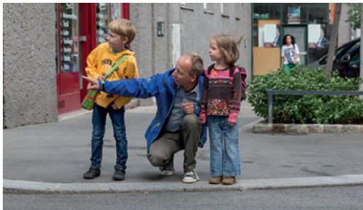
Regelmäßiges, gemeinsames Training ist wichtig!

Gehen Sie mit Ihrem Kind den Schulweg ab und erklären Sie ihm, warum es wo gefährlich ist und worauf es als Fußgänger:in achten muss. Üben Sie problematische Stellen (siehe Schulwegplan) besonders gut! Beim nächsten Mal lassen Sie sich bereits von Ihrem Kind führen, das dabei über sein Verhalten spricht. So können Sie feststellen, ob es alles richtig verstanden hat und eventuell korrigierend eingreifen.