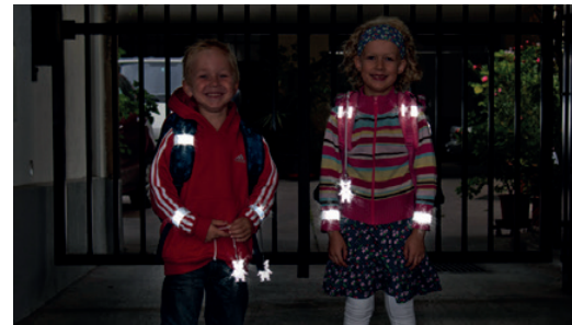
Sicherheit durch Sichtbarkeit!

Sorgen Sie dafür, dass Ihr Kind im Straßenverkehr rechtzeitig gesehen wird! Gerade im Herbst und Winter, wenn es in der Früh noch dunkel ist oder bei nebligem Wetter, ist helle Kleidung von Vorteil. Noch besser wirken Reflektoren an Kleidung und Schultaschen – mit diesen können Kinder schon aus einer Entfernung von 130 Metern wahrgenommen werden.