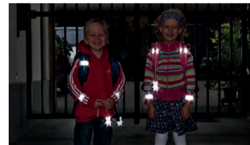
Sicherheit durch Sichtbarkeit!

Sorgen Sie dafür, dass Ihr Kind im Straßenverkehr rechtzeitig gesehen wird. Gerade im Herbst und Winter, wenn es in der Früh noch dunkel ist oder bei nebligem Wetter ist helle Kleidung von Vorteil. Noch besser wirken Reflektoren an Kleidung und Schultaschen – mit diesen können Kinder von Autofahrerinnen und -fahrern schon aus einer Entfernung von 130 Metern wahrgenommen werden.