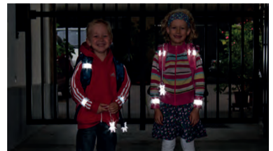
Sicherheit durch Sichtbarkeit!

Sorgen Sie dafür, dass Ihr Kind im Straßenverkehr rechtzeitig gesehen wird. Gerade im Herbst und Winter, wenn es in der Früh noch dunkel ist oder bei nebligem Wetter ist helle Kleidung von Vorteil. Noch besser wirken Reflektoren an Kleidung und Schultaschen – mit diesen können Kinder von Autofahrerinnen und -fahrern schon aus einer Entfernung von 130 Metern wahrgenommen werden.