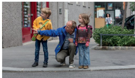
Regelmäßiges, gemeinsames Training ist wichtig!

Gehen Sie mit Ihrem Kind den Schulweg ab und erklären Sie ihm, warum es wo gefährlich ist und worauf es als Fußgängerin bzw. Fußgänger achten muss. Üben Sie problematische Stellen (siehe Schulwegplan) besonders gut. Beim nächsten Mal lassen Sie sich bereits von Ihrem Kind führen, das dabei über sein Verhalten spricht. So können Sie feststellen, ob es alles richtig verstanden hat und eventuell korrigierend eingreifen.