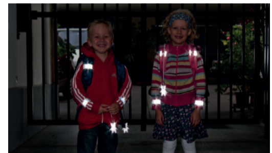
Sicherheit durch Sichtbarkeit!

Sorgen Sie dafür, dass Ihr Kind im Straßenverkehr rechtzeitig gesehen wird. Gerade im Herbst und Winter, wenn es in der Früh noch dunkel ist oder bei nebligem Wetter ist helle Kleidung von Vorteil. Noch besser wirken Reflektoren an Kleidung und Schultaschen – mit diesen können Kinder von Autofahrerinnen und -fahrern schon aus einer Entfernung von 130 Metern wahrgenommen werden.