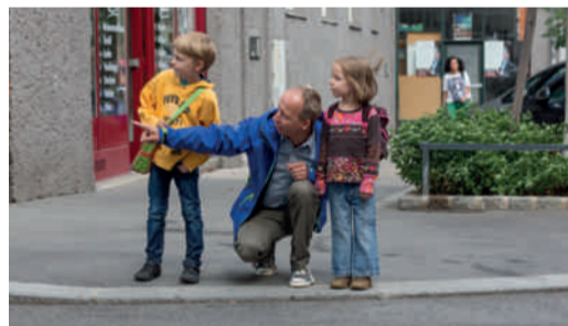
Regelmäßiges, gemeinsames Training ist wichtig!

Gehen Sie mit Ihrem Kind den Schulweg ab und erklären Sie ihm, warum es wo gefährlich ist und worauf es als Fußgängerin bzw. Fußgänger achten muss. Üben Sie problematische Stellen (siehe Schulwegplan) besonders gut. Beim nächsten Mal lassen Sie sich bereits von Ihrem Kind führen, das dabei über sein Verhalten spricht. So können Sie feststellen, ob es alles richtig verstanden hat und eventuell korrigierend eingreifen.