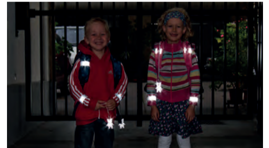
Sicherheit durch Sichtbarkeit!

Sorgen Sie dafür, dass Ihr Kind im Straßenverkehr rechtzeitig gesehen wird. Gerade im Herbst und Winter, wenn es in der Früh noch dunkel ist oder bei nebligem Wetter ist helle Kleidung von Vorteil. Noch besser wirken Reflektoren an Kleidung und Schultaschen – mit diesen können Kinder von Autofahrerinnen und -fahrern schon aus einer Entfernung von 130 Metern wahrgenommen werden.