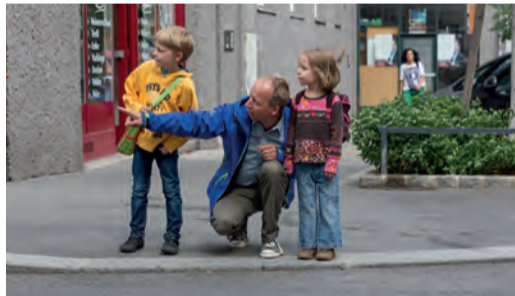
Regelmäßiges, gemeinsames Training ist wichtig!

Gehen Sie mit Ihrem Kind den Schulweg ab und erklären Sie ihm, warum es wo gefährlich ist und worauf es als Fußgängerin bzw. Fußgänger achten muss. Üben Sie problematische Stellen (siehe Schulwegplan) besonders gut. Beim nächsten Mal lassen Sie sich bereits von Ihrem Kind führen, das dabei über sein Verhalten spricht. So können Sie feststellen, ob es alles richtig verstanden hat und eventuell korrigierend eingreifen.